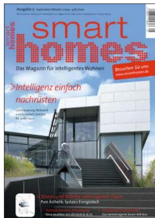
smart homes 5.2009 Smart Homes Pro 1.2010 plugged 6.2009 mobile zeit 5.2009

plugged Media – das ist das Synonym für Medien, die Trends dokumentieren, bevor andere sie überhaupt entdecken. Seit 1999 setzt „plugged“ Maßstäbe, wenn es um neue Designs und Technologien geht. Das Trenddokument ist die Lieblingslektüre zahlloser Entscheider und natürlich aller Design- und Technikfans. „Mobile Zeit“ beleuchtet seit über sechs Jahren erfolgreich den Mobilfunkmarkt aus der Sicht der jungen und dynamischen Zielgruppe – eben der Handygeneration. „Smart Homes“ definiert bereits seit 2004 den Markt für intelligentes Wohnen, die Zukunft in den eigenen vier Wänden. Nun kommt mit „Smart Homes Pro“ das Fachjournal für den Gebäudeprofi und komplettiert die Kommunikation in diesem Segment.